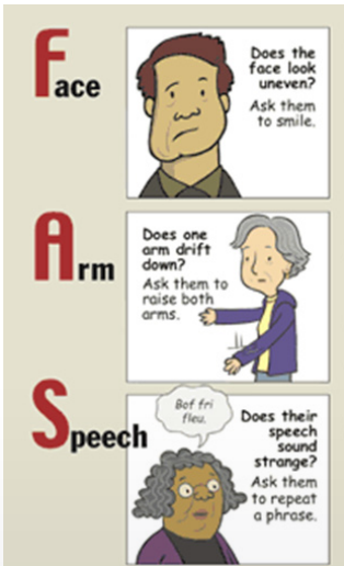
รูปที่ 39 อาการของโรคเส้นเลือดในสมองที่อุดตัน