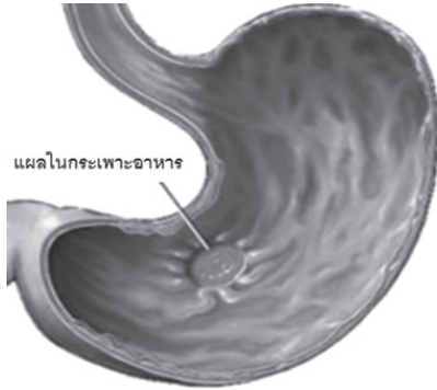
รูปที่ 23 ลักษณะแผลในกระเพาะอาหาร

พบได้ในทุกกลุ่มอายุโดยเฉพาะในวัยทำงาน โดยสาเหตุเกิดจากมีกรดในกระเพาะอาหารมากเกินไป ทำให้เยื่อบุกระเพาะอักเสบหรือเป็นแผลในกระเพาะอาหารได้ ปัจจัยกระตุ้นของโรค ได้แก่ จากการกินอาหารไม่ตรงเวลาหรือกินอาหารรสจัด ความเครียด และพักผ่อนไม่เพียงพอ ผู้ป่วยที่เคยเป็นโรคกระเพาะอาหารอักเสบมักจะมมีอาการเป็นๆหายๆ หากรักษาไม่ต่อเนื่องอาจก่อให้เกิดภาวะแทรกซ้อนที่รุนแรง เช่น กระเพาะอาหารทะลุ เล็ดออกในกระเพาะ เป็นต้น