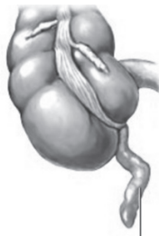
ไส้ติ่งอักเสบ