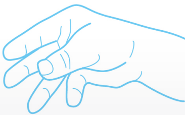
รูปที่ 20 ลักษณะมือจับเกร็งในผู้ป่วย

อาการและอาการแสดง ผู้ป่วยจะมีอาการหายใจหอบเร็ว หายใจลำบาก หน้ามืด เวียนศีรษะ ใจสั่น มักพบอาการเกร็งกล้ามเนื้อโดยเฉพาะกล้ามเนื้อ มัดเล็ก มือจับ และอาจมีอาการชาบริเวณ รอบปากและนิ้วมือได้ อาการเหล่านี้จะ ทำให้ผู้ป่วยกังวลมากขึ้นและยิ่งส่งผลทำ ให้หายใจหอบมากขึ้น